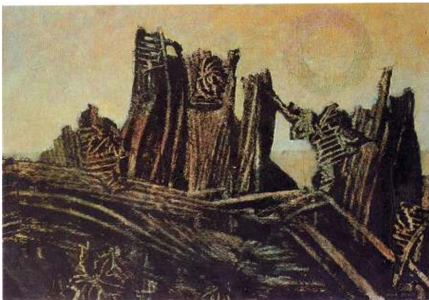
Max Ernst : La Forêt pétrifiée , 1927.