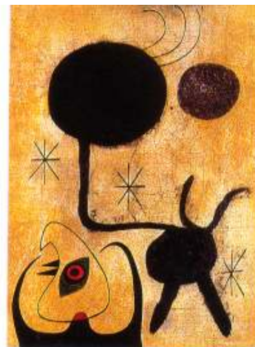
Joan Miró : Femme et oiseau devant le soleil , 1944.

"La peinture de Miró à quoi le surréalisme doit la plus belle plume de son chapeau."