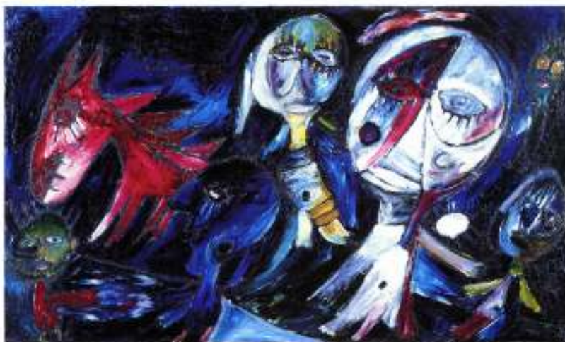
CARL-HENNING PEDERSEN : ÉTRES HUMAINS ET CHEVAL ROUGE 1943 - Huile sur toile, 81 × 135 cm Musée Carl-Henning Pedersen et Else Alfelt, Herning