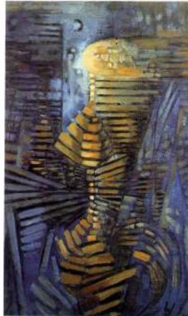
Wolfgang Paalen : La clef Duchamp . Hommage à Marcel Duchamp, 1950.