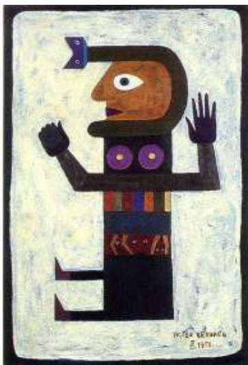
Victor Brauner : L'Emotion immobile , 1956.