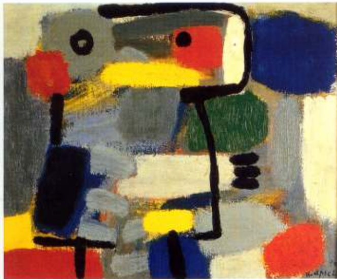
KAREL APPEL : LES ENFANTS 1951. Huile sur toile, 38 x 46,5 cm