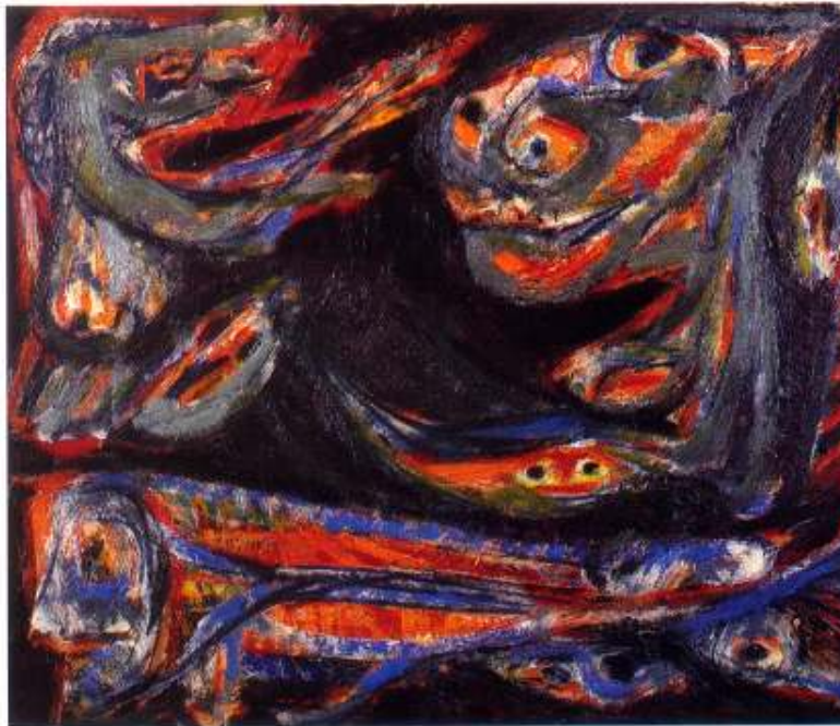
JORN : SPADOMMEN 1951 - Huile sur toile, 46 × 60 cm Jaski Art Gallery, Amsterdam