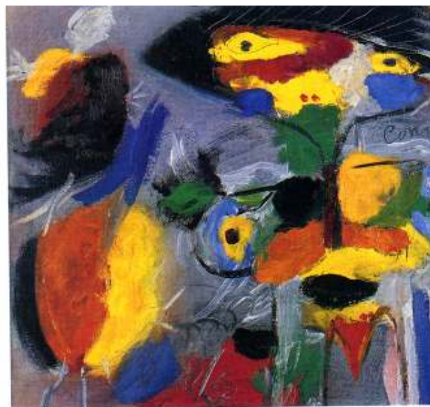
CONSTANT : VÉGÉTATION 1948 - Huile sur toile, 43 x 53 cm Jaski Art Gallery, Amsterdam