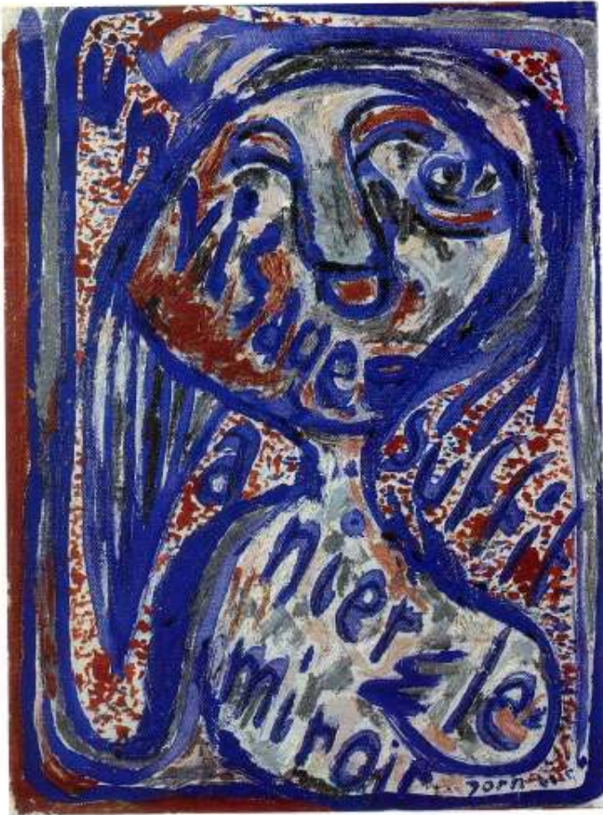
DOTREMONT ET JORN : UN VISAGE SUFFIT À NIER LE MIROIR 1948 - Huile sur toile, 29,5 × 21,5 cm Kunstmuseum, Silkeborg

Corneille et Dotremont : Expériences automatiques de Définition des couleurs.